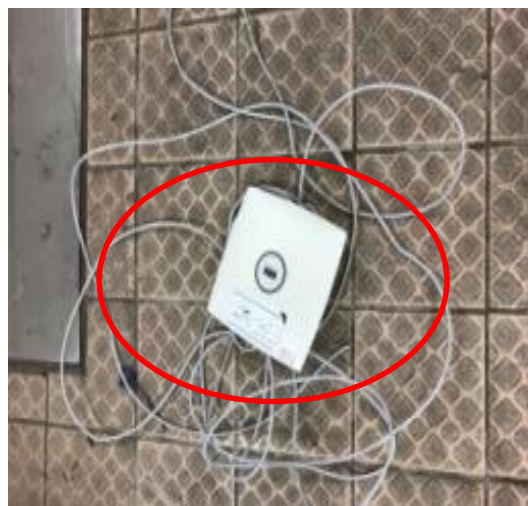
基地台已拆至地上