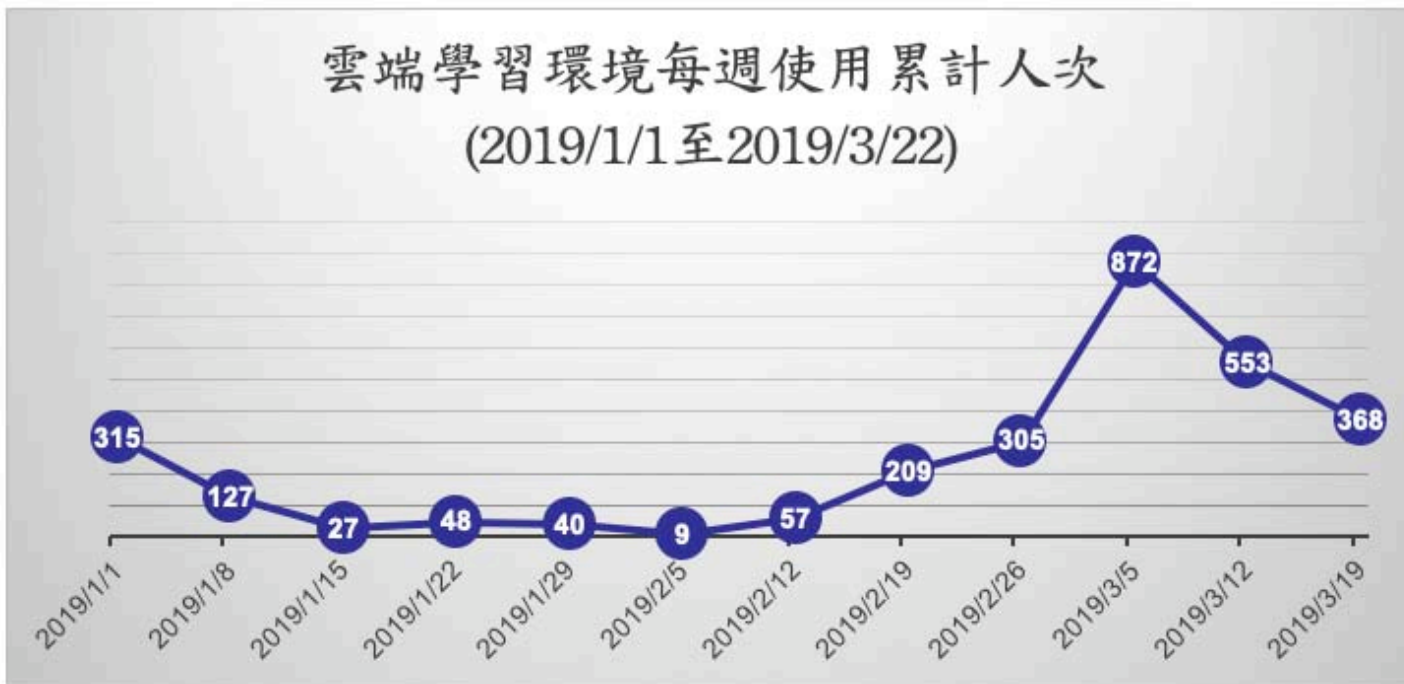
雲端學習環境每週使用累計人次 (2019/1/1至2019/3/22)